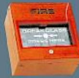
Alarm İkaz Butonu