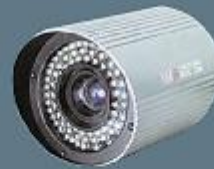
1/3 Renkli Gece Görüşlü Renkli Harici Kamera