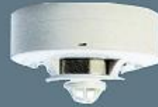
Isı Artış Dedektörü