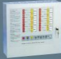
24 Zon Konvaksiyonel Yangın Alarm Paneli