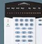
Dikey 12 zon Keypad

24 saat kesintisiz yardım kontrol panelinizden merkezi gözlem istasyonuna gönderilen sinyaller 24 saat, 365 gün izlenerek, polis, itfaiye, hastane vb. servis birimlerine iletilir.