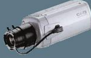
1/3 Renkli Plaka Okuyabilme Özelligine Sahip CCD Kamera