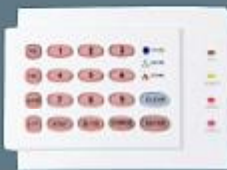
Yatay 8 zon Led Keypad