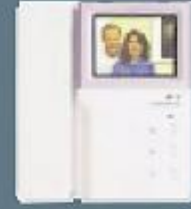
Renkli 4" monitör

Yaygın olarak dairelerde ve vil- lalarda kullanılan sistemimizle evinize gelen misafiri veya satıcıları telefonunuzla canlı olarak göreceksiniz, yine telefonunu- za kapıyı otomatik olarak açacak veya misafiri kabul etmediğinizi sesli olarak iletebileceksiniz.