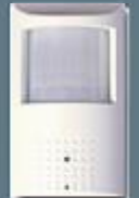
PIR Dedektör Görünümlü Kamera