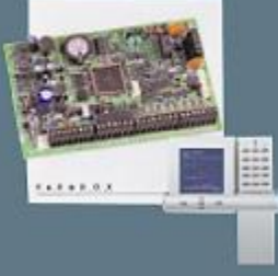
48 Zone Adreslenebilir Kontrol Paneli