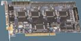
16 Kanal Dijital Görüntü Transfer Kartı