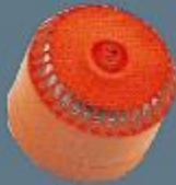
Dış Mekan Yangın Alar Sireni