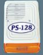
Harici siren. 130 dB ses çıkışı ve güçlü xenon flaşör.