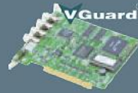
4 Kanal REAL TIME Görüntü Transfer Kartı