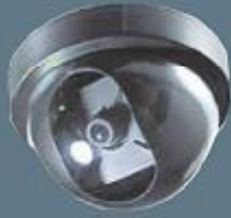
1/4 Renkli Dome

Dijital görüntü aktarım sistemleri sayesinde dünyanın neresinde olursanız olun internet üzerinden kamera sisteminizin kurulu olduğu mekanı izleme imkanına sahipsiniz