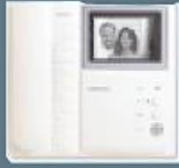
S-B 4" monitör

Yaygın olarak dairelerde ve vil- lalarda kullanılan sistemimizle evinize gelen misafiri veya satıcıları telefonunuzla canlı olarak göreceksiniz, yine telefonunu- za kapıyı otomatik olarak açacak veya misafiri kabul etmediğinizi sesli olarak iletebileceksiniz.