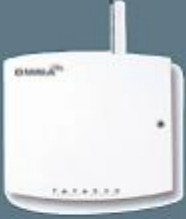
Kablosuz Sistem Alıcı Modül