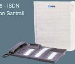
MS 48 - ISDN Telefon Santrali

Telekomünikasyonun rolü bilgi teknolojilerinin gelişimi ile birlikte gün geçtikçe artıyor. Karel size haberleşmede akılcı çözümler ve çağdaş iletişim teknolojilerini sunuyor.