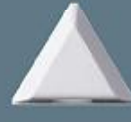
Dikey ve Dar Açılı Dedektör