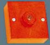
İç Mekan Yangın Alarm Sireni Sireni