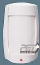
Kablolu Hayvan Dedektörü