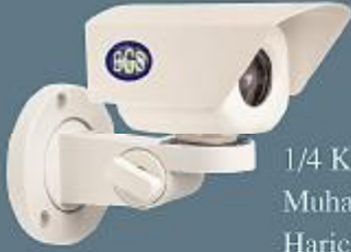
1/4 Kendinden Muhafalı Harici Kamera