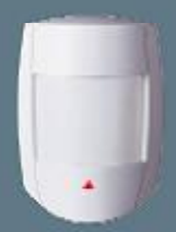
Dijital Hareket Dedektörü

web: www.bgselektrik.com mail: bgselektrik@bgselektronik.com Tel: 0212. 631 93 20 Fax: 0212. 631 91 03