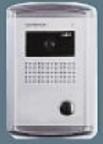
Renkli kamera harici tip