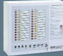
32 Zon Konvaksiyonel Yangın Alarm Paneli