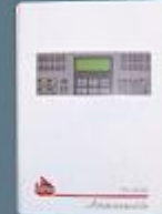
Adresli Dijital Yangın Alarm Sistemi