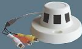
Duman Dedektörü Görünümlü Kamera