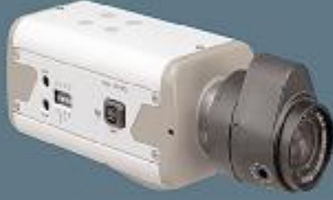
1/3 Siyah/Beyaz 220Volt CCD Kamera

Günümüzde artan şiddet ve hırsızlık olayları güvenlik sorunu yaratmaktadır sizin ve sevdiklerinizin canının ve malının en vefalı bekçisi elektronik güvenlik sistemleridir