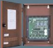
12 Zon Konvaksiyonel Yangın Alarm Paneli