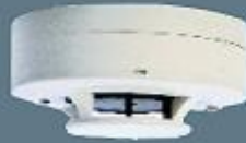
Optik Yangın Alarm Sireni