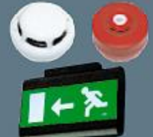
Acil Çıkış Yön Tabelası