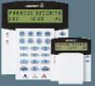
24 Zon LCD Dikey Keypad