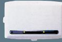
Harici siren. 116 dB ses çıkışlı.