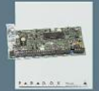
12 Zon Kontrol Paneli