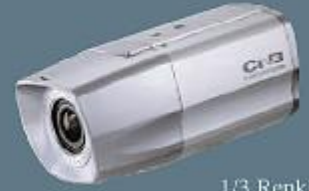
1/3 Renkli 550TVLines Yüksek Çözünürlüklü CCD Kamera

Günümüzde artan şiddet ve hırsızlık olayları güvenlik sorunu yaratmaktadır sizin ve sevdiklerinizin canının ve malının en vefalı bekçisi elektronik güvenlik sistemleridir