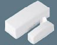
MG-DCT 186 Kablosuz Manyetik Kontak