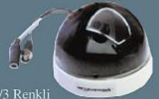
1/3 Renkli Dome Kamera

Dijital görüntü aktarım sistemleri sayesinde dünyanın neresinde olursanız olun internet üzerinden kamera sisteminizin kurulu olduğu mekanı izleme imkanına sahipsiniz