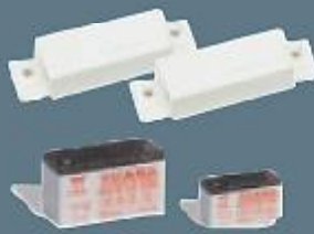
Elektrik kesintilerine karşı 12 volt akü