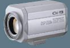
1/3 DAY/NİGT 270 Pixel Renkli CCD Kamera