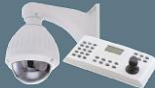
Speed Dome Kamera ve Kontrol Ünitesi