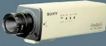
1/3 Renkli Yüksek Çözünürlüklü CCD kamera.