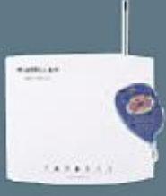
Uzaktan Kumanda Alıcı Modülü