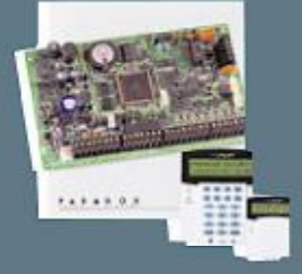
96 Zone Adreslenebilir Kontrol Paneli

Genellikle garaj, çatı arası yada bir dolap içerisine monte edilen kontrol paneli, güvenlik sisteminizin beynidir. Tüm algılayıcıları sürekli olarak denetler, gerektiğinde sesli uyarıcıları aktive eder ve yardım için sinyal gönderir. Kontrol paneliniz, şebeke geriliminin kesilmesi durumunda sisteminizin çalışması için akü yedeklemesine de sahiptir.