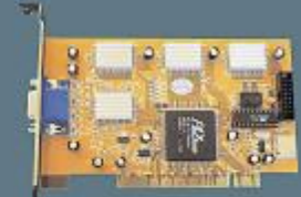
8 Kanal Dijital Görüntü Aktarım Kartı